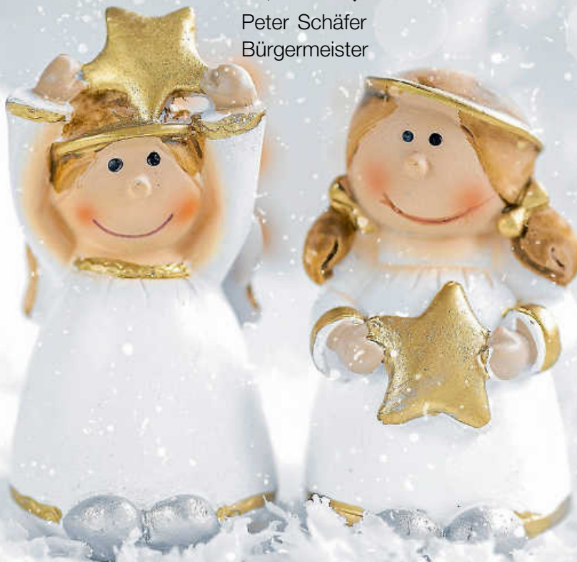
Peter Schäfer Bürgermeister