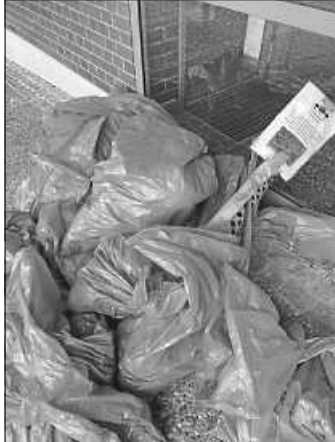
Da hat sich ganz schön was angesammelt

Eine besondere Aktion fand kurz vor dem Wochenende noch in der Grundschule im Ortsteil Hochdorf statt. Die gesamte Schule hat die Klassenzimmer ins Freie gelegt und ist dem Müll in der Natur zu Leibe gerückt. Die Wege führten in den Wald, zum Spielplatz, in den Sportplatzbereich und auf das Gelände rund um die Schule herum. Das Wetter konnte die Vorfreude dabei nicht trüben. Gut ausgestattet mit gummierten Handschuhen, Leuchtwesten, Müllzangen und jeder Menge Mülltüten ging es raus in die Natur. Bestens gelaunt und hoch motiviert machten sich die Kinder ans Werk und brachten