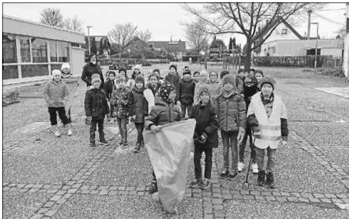
Gleich geht's los

tatsächlich „reichlich Beute“ zurück zum Schulgelände. Neben den erwarteten Gesichtsmasken und Kartonresten von Fastfood und Pizza fanden die Kinder vor allem im Wald unzählige leere Bierflaschen, Glasscherben und Kronenkorken sowie natürlich die obligatorischen Zigarettenkippen. Aber auch ein Stuhl wurde gefunden, ein Schild samt Mast sowie altes Metall. Der aufregende Fund eines Tierknochens gab reichlich Anlass zu Spekulationen und könnte demnächst ein Kinderzimmer zieren. Die Kinder haben bei dieser Aktion einen Eindruck erhalten, wie achtlos mit der Natur umgegangen wird, wenn man seinen Müll einfach in die Landschaft wirft. Sie wünschen sich, dass ihr Umfeld sauber und vor allem sicher ist und dass mehr Rücksicht auf die Natur, die Tiere und die Kinder genommen wird, die draußen spielen. Ein großes Dankeschön an die Hochdorfer Schulkinder mit ihren KlassenlehrerInnen. Heute waren die „Kleinen“ mit ihrer Aktion ein großes Vorbild.