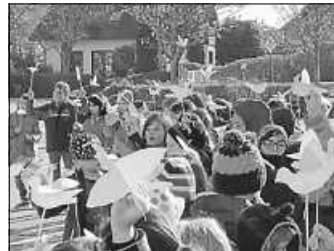
Friedenstauben aus Papier

Unsere Kinder lernen, singen, spielen zusammen, sie machen gemeinsam Sport und messen sich gegeneinander, sie haben Meinungsverschiedenheiten, sie streiten, diskutieren und versöhnen sich wieder. Und sie machen sich heute zusammen für den Frieden stark. In einer gemeinsamen Aktion singen sie für den Frieden „Hevenu Shalom Alechem - Wir wünschen Frieden euch allen“, stellen dabei „ihre“ Länder vor und sagen, was Frieden für sie bedeutet.