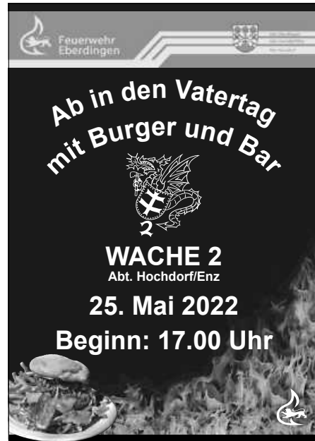
Plakat: M. Hiemer, Abt. Hochdorf