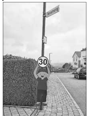
Ein Patenkind in der Nähe des Kindergarten Blumenstraße im Einsatz

Weitere Kinder befinden sich bereits in der Produktion. Wer noch das Bedürfnis hat sich an dieser Aktion zu beteiligen und ebenfalls eine Patenschaft für eines unserer Holzkinder übernehmen möchte, der kann dies tun. Wir freuen uns über jede Unterstützung.