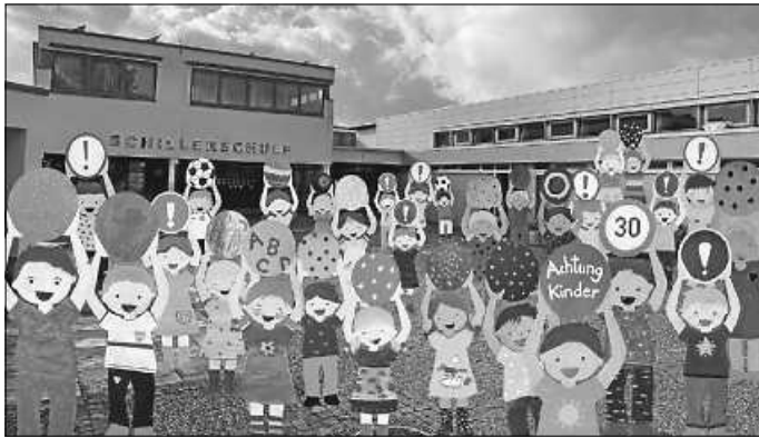
Unsere Paten Kinder warten auf ihren Einsatz