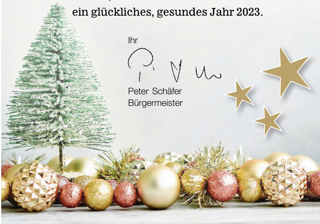
Peter Schäfer Bürgermeister