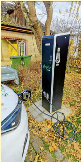
E-Ladesäule, Parkplatz bei der Post

Seit letztem Jahr heißt es auch in den Ortsteilen Eberdingen und Nussdorf „elektrisch mobil“. Neben dem Standort auf dem Parkplatz des Keltenmuseums in Hochdorf stehen nun auch Lademöglichkeiten in Eberdingen, Stuttgarter Straße 51 (am Waschkäse bei der Post) und in Nussdorf am Friedhof, Mönshöfer Weg 7 zur Verfügung. Die Ladesäulen haben 2 Ladepunkte mit je maximal 22kW Ladeleistung und werden mit Ökostrom aus 100 % Wasserkraft gespeist. An allen drei Ladesäulen stehen e-Carsharing Fahrzeuge zur Verfügung. Nähere Informationen finden Sie unter: www.deer-carsharing.de .