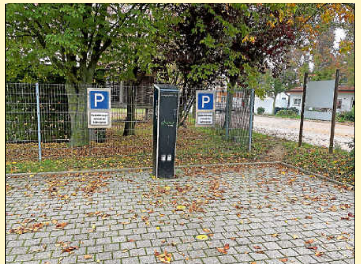
E-Ladesäule am Parkplatz beim Keltenmuseum