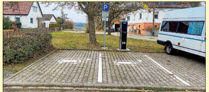
E-Ladesäule, Parkplatz Friedhof Nussdorf

Die öffentlichen Ladesäulen in Eberdingen, Nussdorf sowie die private Wallbox in der Rathausgarage werden vom Land Baden-Württemberg im Rahmen der Landesinitiative III Marktwachstum Elektromobilität BW „Förderung von Ladeinfrastruktur in Baden-Württemberg (Charge@BW)“ gefördert. Für die Ladesäulen in Eberdingen und Nussdorf erhält die Gemeinde eine Förderung von je 5.000 € und für die Wallbox in der Rathausgarage eine Förderung in Höhe von 1.648,64 €.