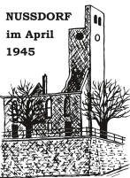
NUSSDORF im April 1945