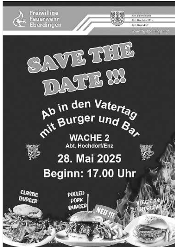
Plakat: Abt. Hochdorf