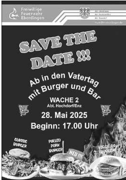
Plakat: Abt. Hochdorf