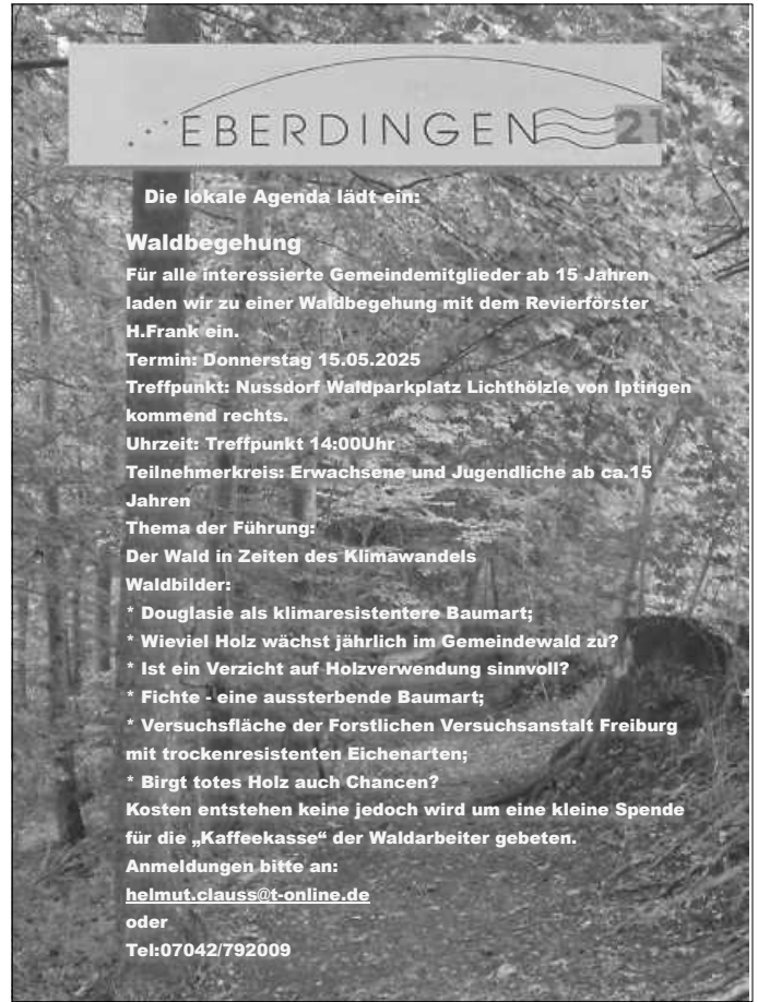
Plakat: Lokale Agenda