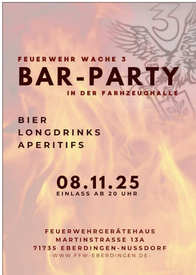
Plakat: Abt. Nussdorf