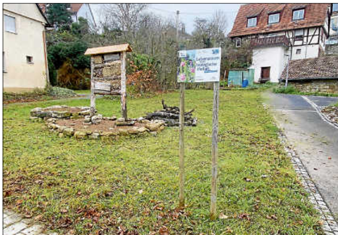
Wildbienen und Insektenareal