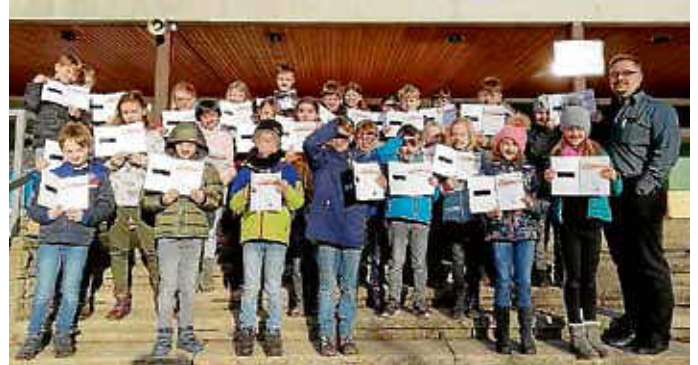
Die Nussdorfer Kinder mit ihren Urkunden und Sportabzeichen in Gold.

werden. Auf diese Leistung darf man dann stolz sein, wenn man seine Urkunde mit dem Sportabzeichen überreicht bekommt. Herzlichen Glückwunsch an alle kleinen und großen SportlerInnen. Im nächsten Jahr geht es weiter.