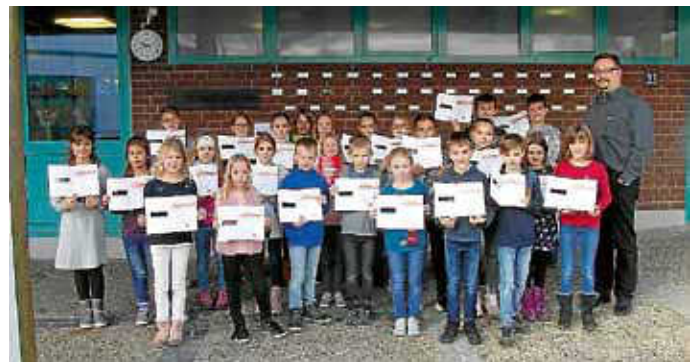
Die SchülerInnen mit dem Sportabzeichen in Gold in Hochdorf