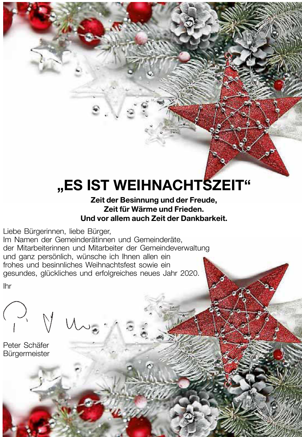
Peter Schäfer Bürgermeister