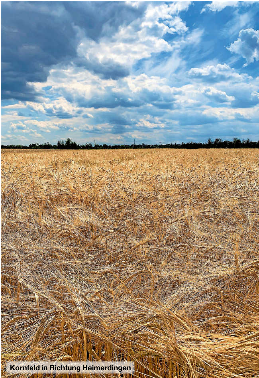
Kornfeld in Richtung Heimerdingen